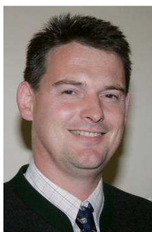
Ihr Bürgermeister: Franz Linsbauer

Wir wünschen unseren Kindern und Jugendlichen in der Volksschule, im Kindergarten und natürlich an allen anderen Schulen einen guten Start, viel Freude und Spaß am gemeinsamen Lernen und Bewegen, vor allem aber ein gesundes und unfallfreies Schul- bzw. Kindergartenjahr!